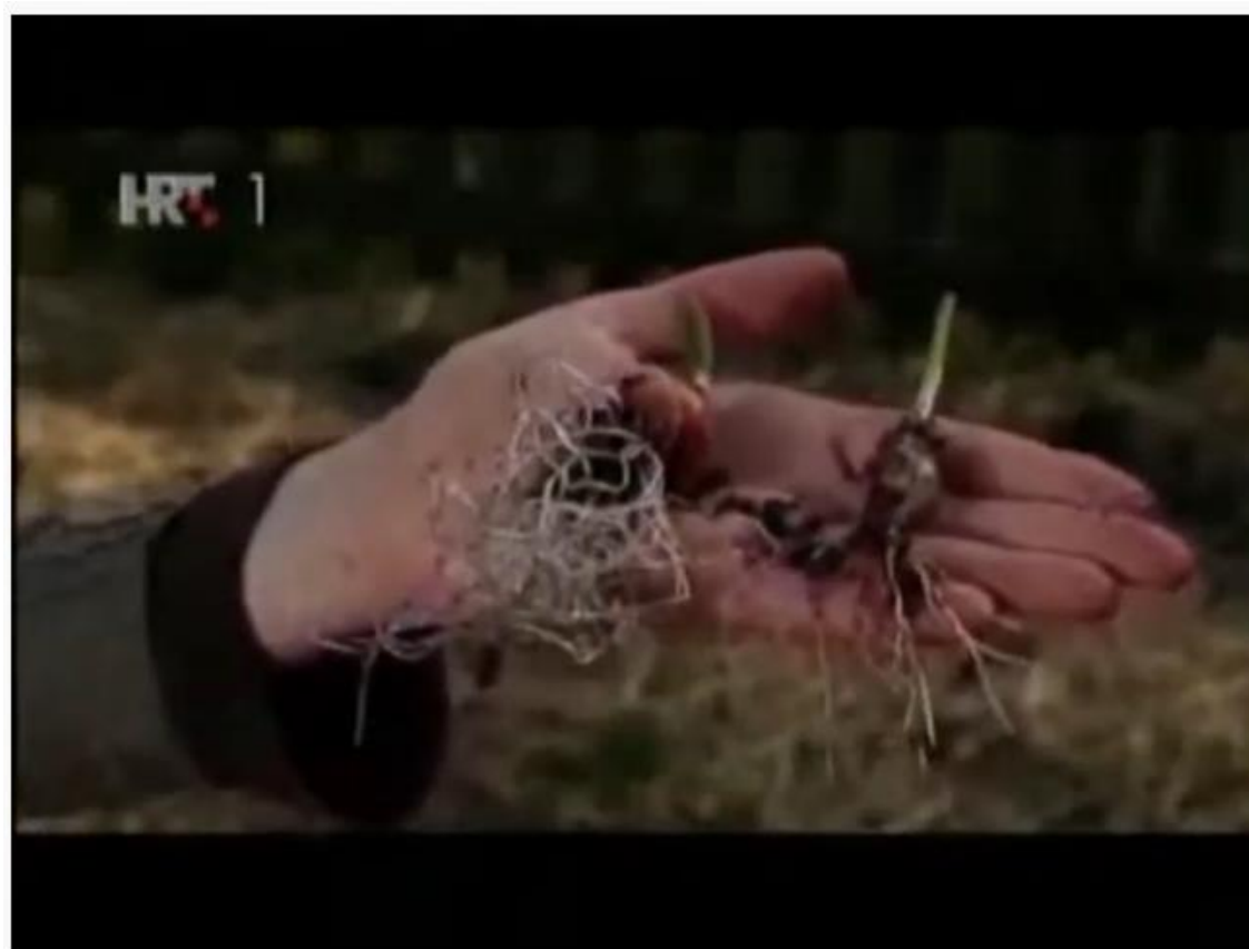
Vrtlarica 2012. - Zeolit